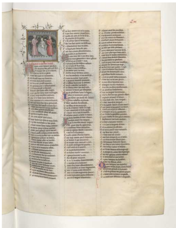
Susana y los viejos.

Confort d'ami de Guillaume de Machaut, 4º cuarto del s. XIV, París (Francia). París, BnF, Ms. Français 9221, fol. 93.