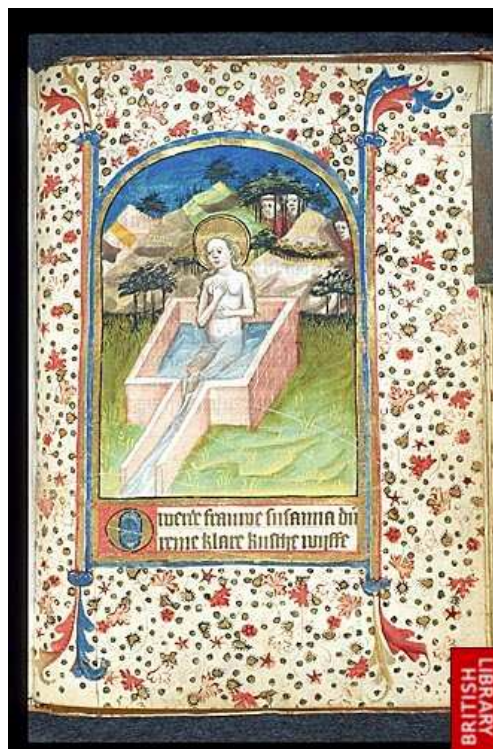
Susana y los viejos.