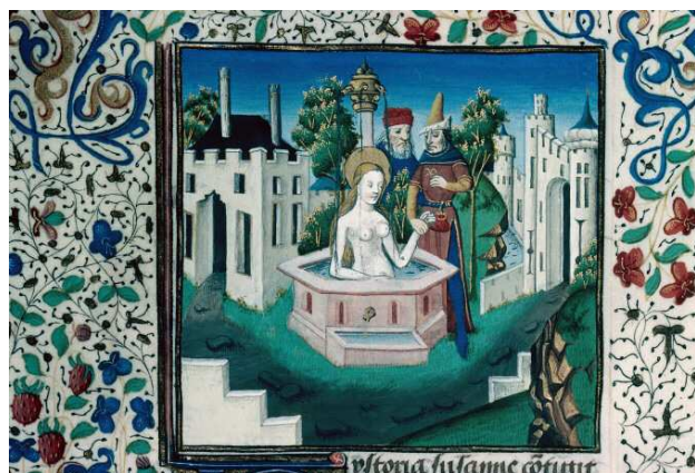
▲ Susana y los viejos.

http://molcat1.bl.uk/IIImages/Kslides%5Cmid/K063/K063867.jpg [captura 31/05/2012]