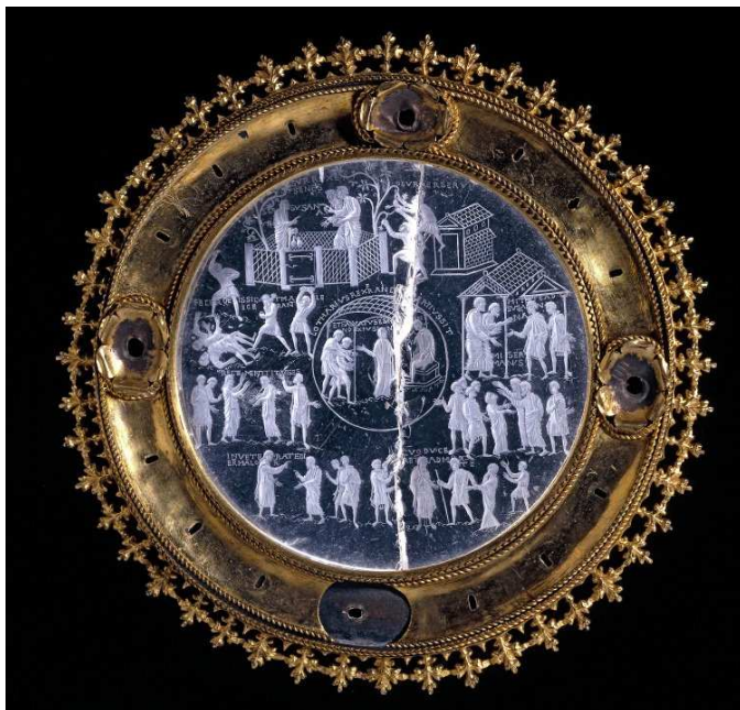
Historia de Susana. Cristal de Lotario II, ca. 843-869, ¿Aquisgrán? (Alemania). Londres, The British Museum.

http://www.britishmuseum.org/collectionimages/AN00191/AN00191975_001_1.jpg [captura 31/05/2012]