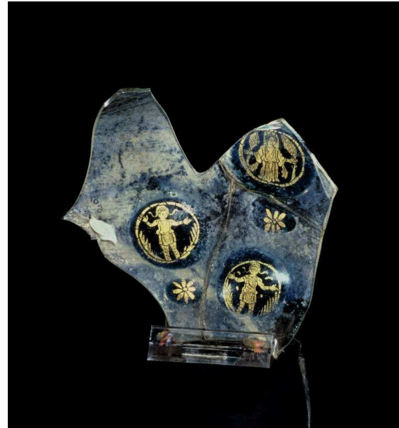
Medallón con la imagen de Susana. Resto de cuenco de cristal dorado, finales del siglo IV, Colonia (Alemania). Londres, The British Museum.

http://lh4.ggpht.com/-Vh7PTeTCtXA/SF6y6n9Ti5I/AAAAAAAAIXY/2mOSNuwqUaE/112%252520Catacumbas%252520de%252520Priscilla%252520Susana%252520y%252520los%252520viejos.jpg [captura 31/05/2012]