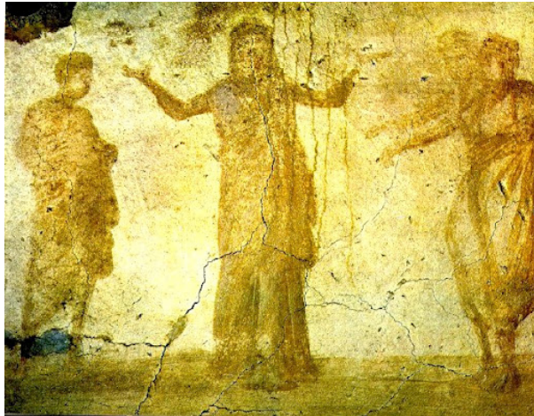
Susana acusada por los viejos. Catacumba de Priscila, Capilla Griega, Roma (Italia), s. III.

http://lh4.ggpht.com/-Vh7PTeTCtXA/SF6y6n9Ti5I/AAAAAAAAIXY/2mOSNuwqUaE/112%252520Catacumbas%252520de%252520Priscilla%252520Susana%252520y%252520los%252520viejos.jpg [captura 31/05/2012]